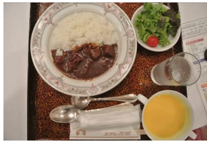
『ビーフカレーライス』