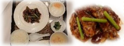
若鶏の黒酢ソース