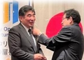
新旧会長・幹事によるバッジ交換

先ほど強引に開催しました臨時理事会におきまして、2名の新入会員、1名の交代が無事承認されました。しかしまだ決算の仕事が残っています。