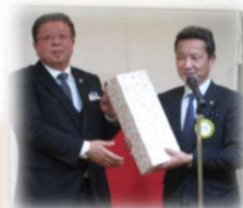
←平塚 RC 様より贈呈