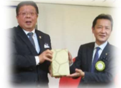
花巻 RC → から贈呈