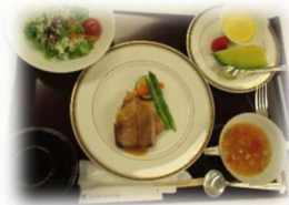
白金豚ロース 生姜焼