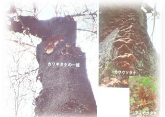
↑桜の木についたきのこ

今年はやっぱりクマですね。青森、岩手、宮城、秋田、山形の 5 県で 145 か所でブナの実の付き具合を見ているらしいんですけども、その大半で実が付いていないというような結果だったということで、2019 年もそういうブナが実を付けなかったそうなんですけども、それで今年クマがもう冬眠するのにお腹空いて町に来ていると。この前、マタギの方に豊沢ダムで会ったんですけども、その方にも栗の落ちてるところには長居するなとか、あと夕方遅くなったらクマに襲われるから絶対にもう遅くなるなっていうふうなことは言われました。で、クマに襲われたらどうするかっていうところなんですけど、これ出会ったらって言いますけど、もう自分から行くというよりは向こうから最近来るクマが多いみたいで、向かってきたらとにかく顔と頭を覆って、致命傷を避けるということ。あとは、スプレーをって言うんですけど、急に来てもあれ、たぶん取り出せないだろうなということで、なるべくクマが動くような時間帯、クマの出そうな時期には出歩かないというのが一番いいのかなというふうに思います。ということで、簡単ではございますませんが、きのこ活動でございました。ありがとうございました。