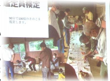
↑鑑定員検定試験の様子