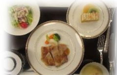
白金豚ロースステーキ 生姜ソース